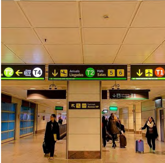
مطار باراخاس الدولي

يقع مطار باراخاس الدولي ، على بعد 13 كم ، من وسط المدينة وهو واحد من اكبر المطارات في أوروبا .