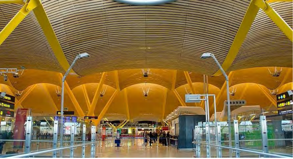
Barajas Airport (MAD)