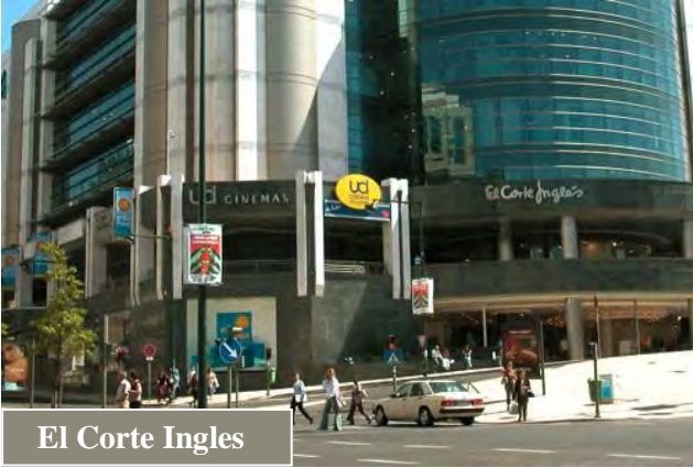
El Corte Ingles

هو واحد من اكبر مراكز التسوق في اوروبا ، وهو مركز تسوق ترفيهي ، ويضم العديد من المطاعم بالاضافة للبولينج ، ونادي صحي ودور سينما متعددة ، وملاهي وغير ذلك من المتعة والترفيه .