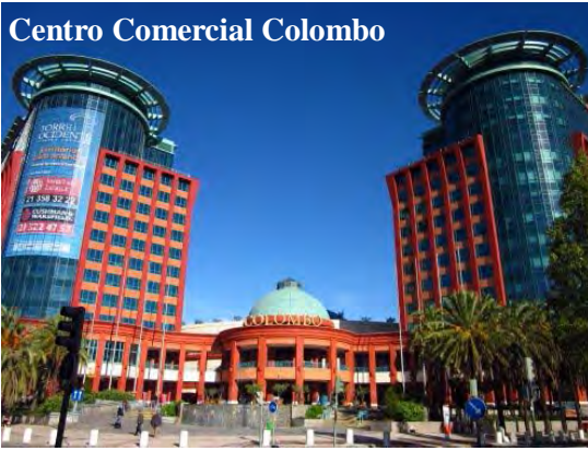
Centro Comercial Colombo

في اخر محطات التسوق يمكننا ان نستمتع قليلا بتناول معجون اللوز :-