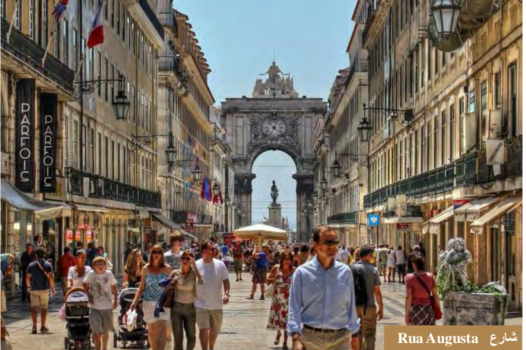
شارع Rua Augusta