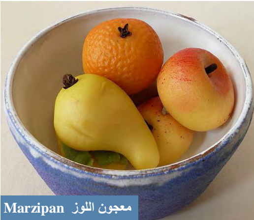
معجون اللوز Marzipan

اذا كانت رحلتك القادمة إلى لشبونة ، فاننا نقترح عليك هدية رائعة لمن تحب ، وهي معجون اللوز اللذيذ ، يمكنك ان تجده في المحلات في Baixa