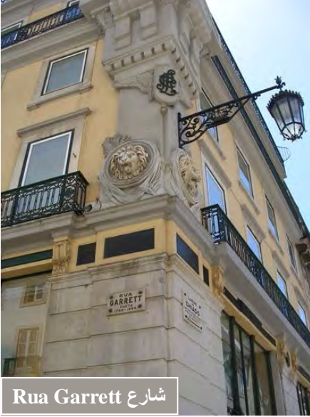
شارع Rua Garrett