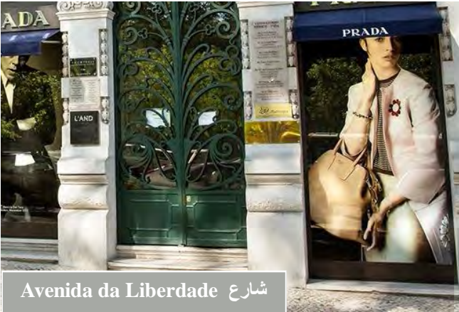
شارع Avenida da Liberdade

هذا الشارع من الشوارع الراقية في لشبونة ، يمتاز باتساعه ، وهو يحتوي على العديد من الماركات العالمية بالإضافة للمطاعم الراقية وذات الجودة العالية ، بالإضافة للفنادق . انظر الخريطة .