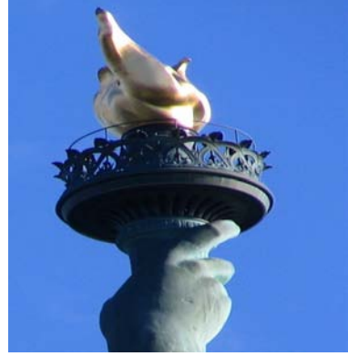
مشعل مجسم الحرية الآن

المشعل الاصلي الذي كان في يد تمثال الحرية والذي تم في عام 1984 ، تم تغييره بمشعل جديد مطلي في اعلى الشعلة بالذهب عيار 24 .