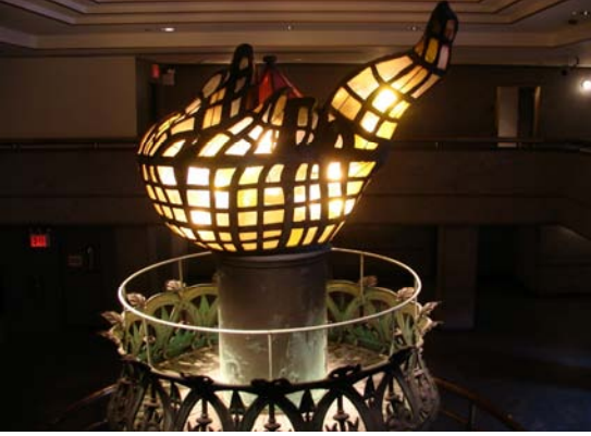
مشعل مجسم الحرية قبل