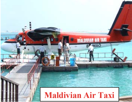
Maldivian Air Taxi

2- في حاله استخدامك الطائرة البحرية ، يستقبلك المضيف وينقلك بالحافلة (الباص) إلى مكان آخر ربما تنتظر لفترة في غرفة الانتظار حتى وصول الطائرة التي سوف تنقلك إلى منتجعك . جميع الطائرات البحرية تتمثل في شركتين هما (Maldivian Air Taxi - Trans Maldivian) جميع الطائرات البحرية لا تقلع في الليل .