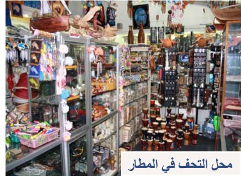
محل التحف في المطار