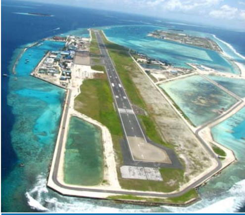
جزيرة مطار ماليه ( داخلي ودولي )