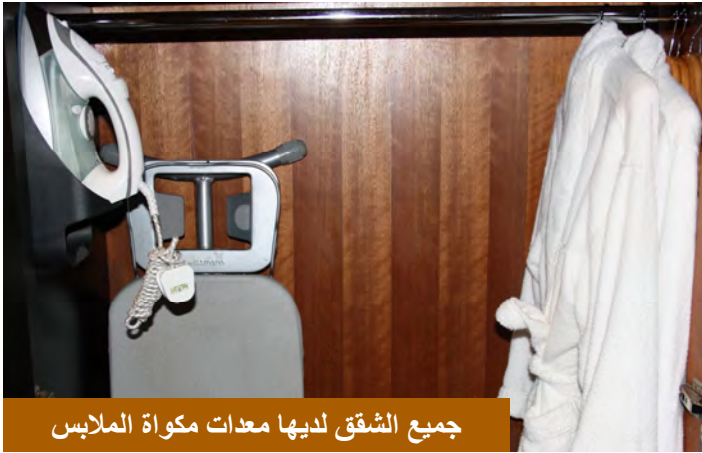
جميع الشقق لديها معدات مكواة الملابس

او يمكنك مشاهدة وانت تسترخي على سريرك في داخل غرفتك حيث يوجد تلفاز اخر في غرفة النوم وكل ذلك مراعاة من أكوود لراحة النزلاء ، كما توجد خزانة مخصصة للملابس واخرى للاوراق المهمة والاشياء الثمينة .