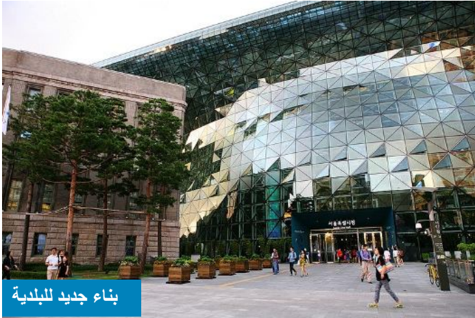
بناء جديد للبلدية

ان اطراف جامعة سينول Hongik وهي منطقة للشباب تحتوي على العديد من المقاهي والمطاعم .