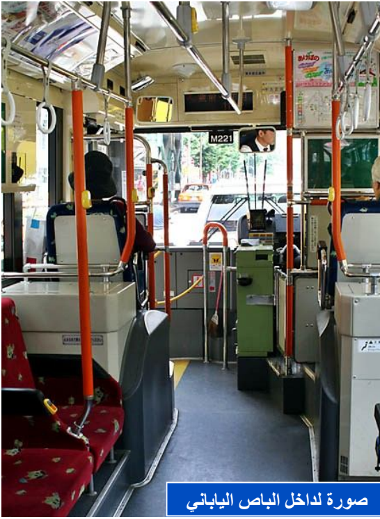
صورة لداخل الباص الياباني

في جميع انحاء اليابان يتميز التاكسي بالنظافة والنظام والخدمات الدقيقة ، بالاضافة لعدم الاستغلال ولكن عيبه هو انه غالي جدا ، فان كنتم ثلاثة اشخاص او اربعة فالسعر يعتبر مناسب جدا .