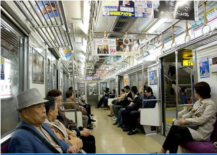
صورة لداخل المترو

بعض محطات اليابان كبيرة جدا وعند النزول من القطار سوف تذهل لسعة مساحتها ومخارجها المتعددة فلا تقلق ، فأغلب المحطات تحتوي على اللغة الانجليزية بالنسبة للارشادات والتوضيحات ، كما يمكنك السؤال فالكل يرحب بالاجابة ويسعدهم ذلك كما ان الاغلبية خاصة الفئة الشابة يتحدثون الانجليزية .