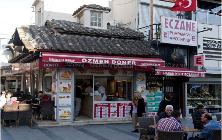
دويزر كباب من الماكولات المشهورة في انطاليا