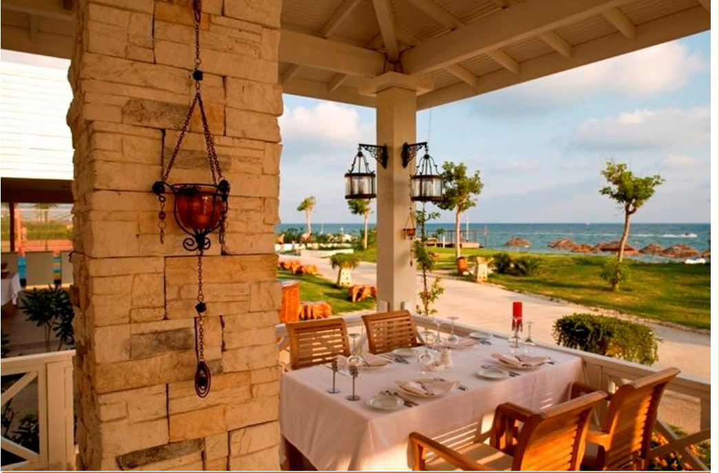
اغلب المنتجات لديها مطعم باطلاله رائعة جدا مقابل للبحر