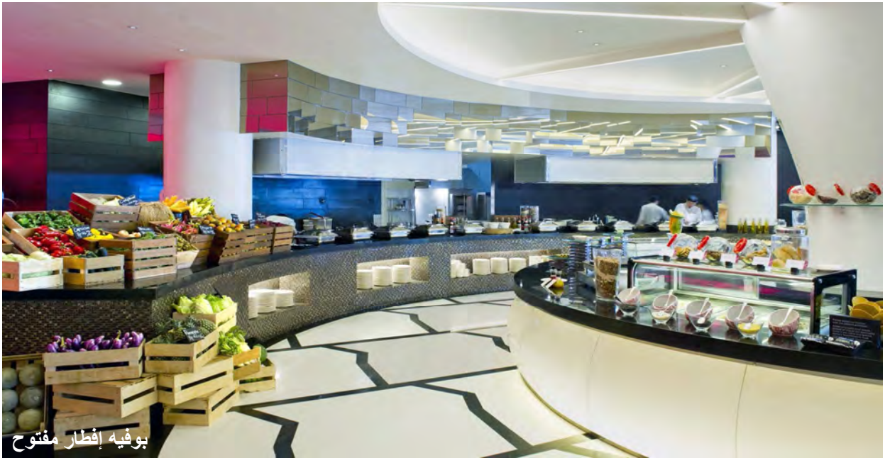
بوفيه إفطار مفتوح

وهناك شوف تشاهد الحافلة رقم 1 والحافلة رقم 3 حيث ، يمكنك الذهاب من خلالها الى اماكن مختلفة في بالي ، والاستمتاع بوقتك بصورة افضل .