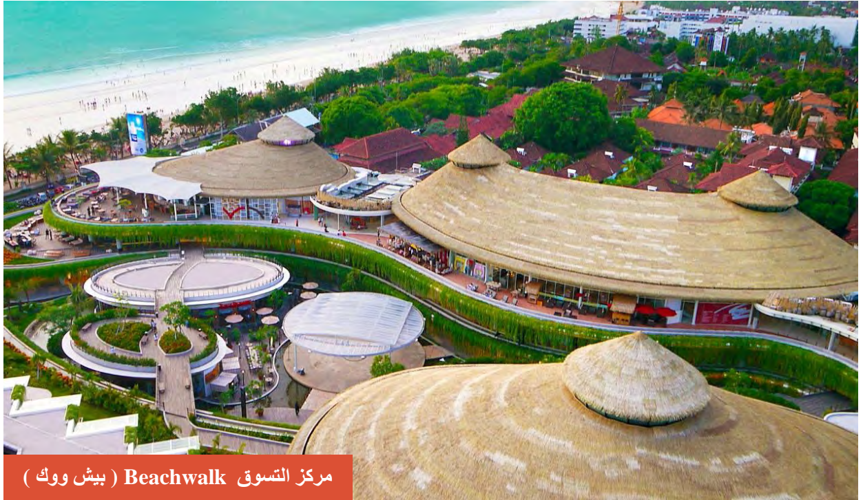
مركز التسوق Beachwalk ( بيش ووك )

ويقع المركز المذكور مواجه الشاطئ ، حيث يمكنك مشاهدة العديد من المقاهي والمطاعم ، في الداخل والخارج كما يضم المركز لعشاق السينما سينما ثلاثية الابعاد .