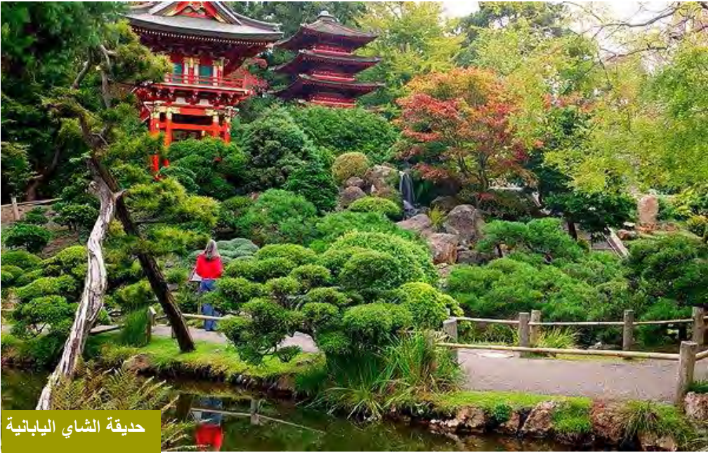
حديقة الشاي اليابانية

اما لعشاق الثقافة والمتاحف ، فقد اخترنا :-