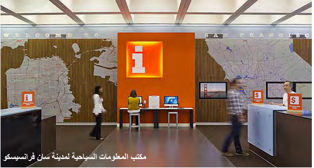
مكتب المعلومات السياحية لمدينة سان فرانسيسكو

بالنسبة لمكتب المعلومات السياحية لمدينة سان فرانسيسكو ، فانه يقع في مركز التسوق والمتاجر المتنوعة Macy's وكذلك بالقرب من مركز التسوق المشهور Westfield في Hallide Plaza .