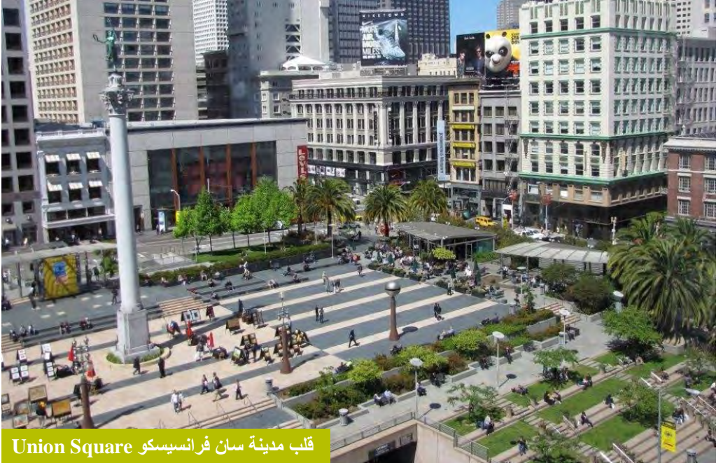
قلب مدينة سان فرانسيسكو Union Square

ان من المعالم والمناطق المثيرة للاهتمام ، في مدينة سان فرانسيسكو والذي يجب تسليط الضوء عليه دائما ، هو الحي الصيني ( اذا يبلغ عدد الصينيين في هذه المنطقة حوالي 20% من سكان مدينة سان فرانسيسكو ) وتتميز هذه المنطقة بانها تعتبر الصين بصورة مصغرة ، حيث العمران والثقافة الصينية تطغي عليها .