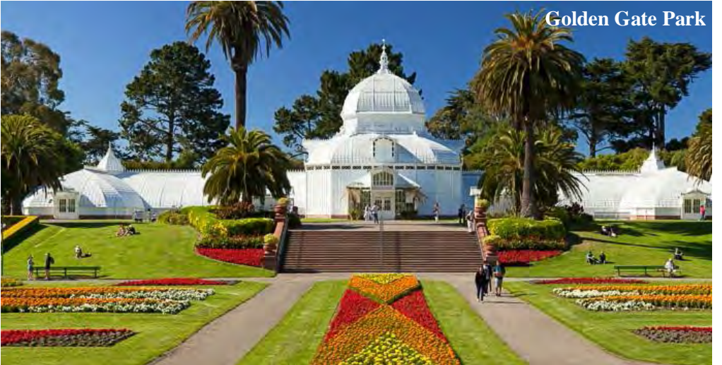
Golden Gate Park

لمزيد من الاطلاعات :- www.japaneseteagardensf.com