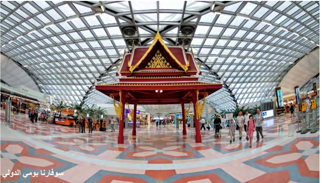
سوفارنا بومي الدولي

يوجد داخل المطار مكتب للمعلومات السياحية - تايلند ، بالإضافة للعديد من المقاهي والمطاعم ، وسوق حرة كبيرة جداً .