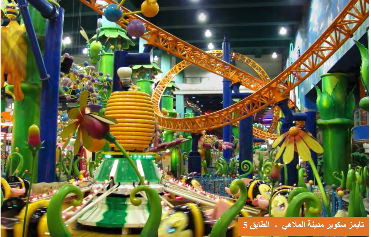
تايمز سكوير مدينة الملاهي - الطابق 5

من مراكز التسوق الكبرى الواقعة بالقرب من فندق برجايا بأفيليون ، وهو من المراكز الكبرى التي تضم العديد من الماركات العالمية ، والمطاعم الراقية بالإضافة للمعجنات ذات الجودة العالية ، كذلك من المراكز القريبة من الفندق كل من فخرنهايت ولويات بلازا وكذلك شارع العرب وبتروناس KLCC ، ويضم بالقرب منه العديد من المطاعم العربية والصيدليات . فانت بالاقامة في فندق برجايا ضمنت العديد من مراكز التسوق ، دون عناء يذكر فيمكنك السير إليها على الاقدام ، ولن تشعر بمرور الوقت لان كل ما يحيط بالفندق ، عبارة عن مراكز ومطاعم وغير ذلك مما ذكرنا . ويبعد فندق برجايا عن مطار كوالالمبور حوالي ساعة او 45 دقيقة .