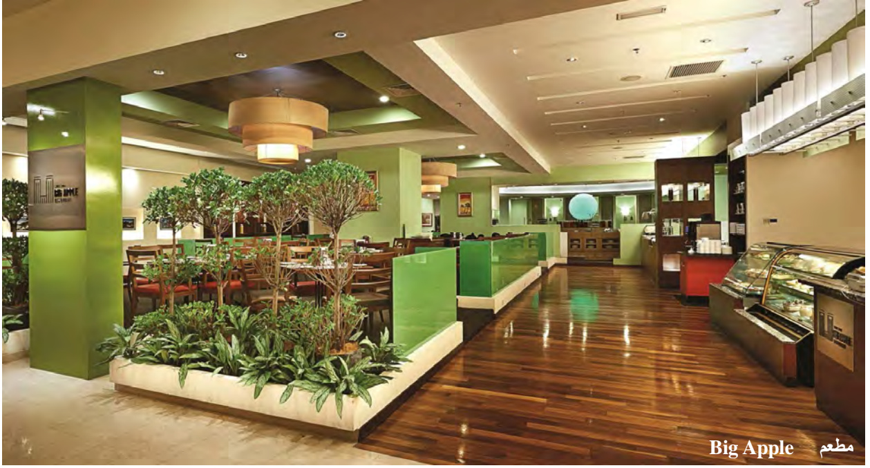
مطعم Big Apple

الافطار المجاني الذي يقدمه برجايا هو عبارة عن بوفيه ، يضم العديد من الاطباق المختلفة التي تتناسب ، مع كافة الأذواق ويقدم الافطار في ( الطابق 14 - Big Apple ) .