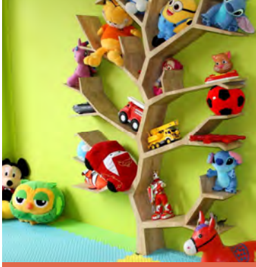
هناك روضة كبيرة وحديثة.

هنا يمكنك الانتعاش في بعض ساعات النهار واعادة الطاقة ، الى بدنك عن طريق السباحة او حتى الجلوس بالقرب من المكان ، اما ان كنت من محبي السباحة مساءً فان هذا يعطيك فرصة اخرى، لمشاهدة الهدوء الذي يحيط بالمكان والانوار تسترسل في حمام السباحة .