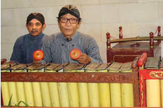
الإفطار مع الموسيقى التقليدية الإندونيسية ( Gamelan - جاميلان )

بعد هذا الوصف السريع ربما حان الوقت للعودة للغرفة ، والاسترخاء بها حيث سوف تنام نوماً عميقاً في سريرك الرائع ، الذي يوفره لك هذا الفندق الجذاب .