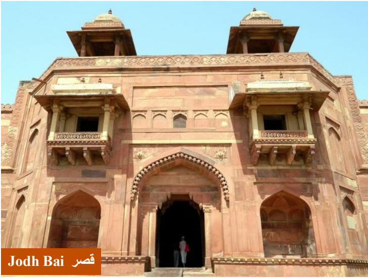
قصر Jodh Bai

ويدخل هذا المسجد وفي أكبر منطقة منه يوجد ضريح الشيخ سليم خيستي ، وهو من الزهاد وله حكاية لطيفة جدا مع أكبر شاه ، حيث كانت جميع اولاد الشاه من الاناث بالرغم انه متزوج من ثلاث نساء ، وحين قدم الشيخ الزاهد سليم خيستي طلب منه الدعاء له بصبي وفعل الزاهد ذلك واستجاب الله له حيث رزق أكبر شاه بولد . ويحتوي المسجد على محراب يعد استثنائي جدا لروعة وتصميمة الفريد .